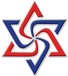
Das Symbol der kosmischen Energie

Der SEALAND-Generator enthält weder Magnete noch Kraftzellen noch andere elektrische Teile. Er klinkt sich in das kosmische Energiefeld ein und kanalisiert diese Energie zur positiven Nutzung.